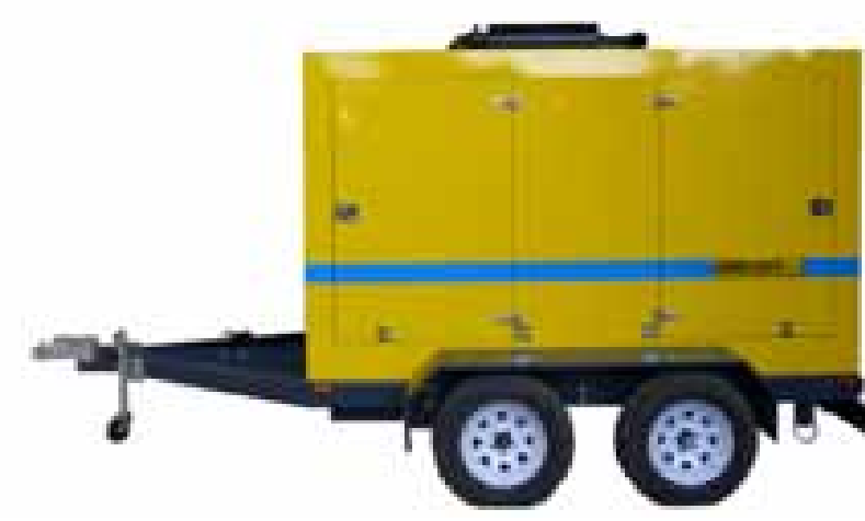
Diesel, sobre carro de arrastre, con o sin carenado.