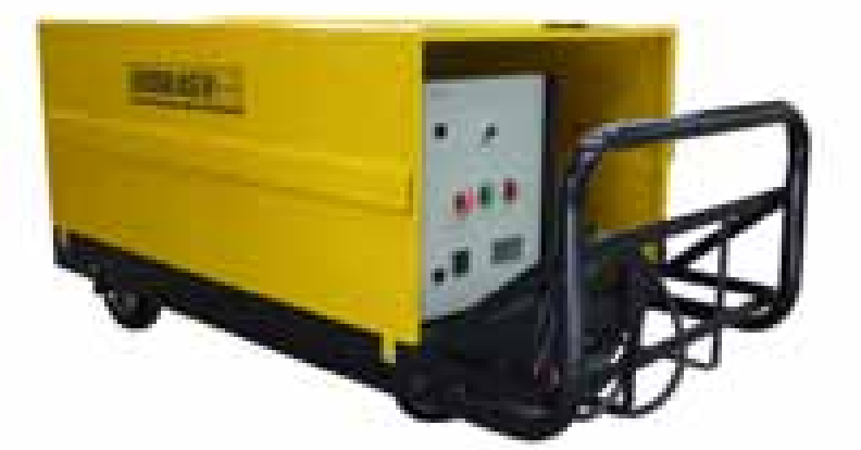
Eléctrica / Diesel sobre carro manual

Cada sistema de alta presión Hidrolaser, puede ser configurado de acuerdo a las necesidades del cliente para obtener su máxima funcionalidad y prestaciones.