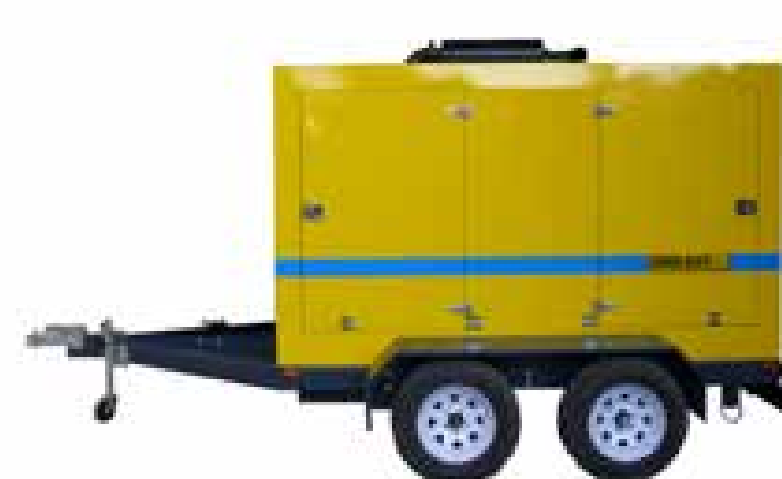
Diesel, sobre carro de arrastre, con o sin carenado.