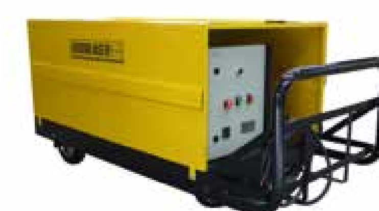
Eléctrica / Diesel sobre carro manual

Cada sistema de alta presión Hidrolaser, puede ser configurado de acuerdo a las necesidades del cliente para obtener su máxima funcionalidad y prestaciones.