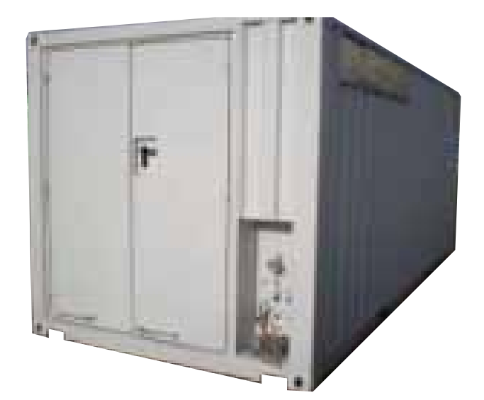
Equipos en container, estacionarios o sobre chasis

Cada sistema de alta presión Hidrolaser, puede ser configurado de acuerdo a las necesidades del cliente para obtener su máxima funcionalidad y prestaciones.