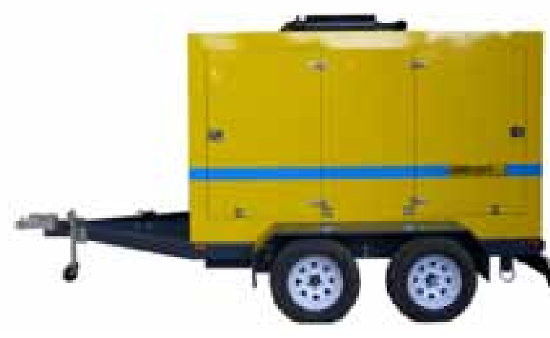
Diesel, sobre carro de arrastre, con o sin carenado.