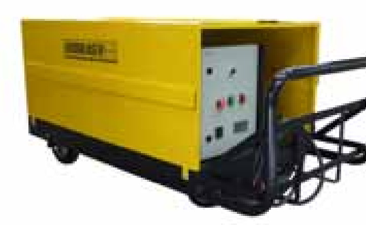
Eléctrica / Diesel sobre carro manual