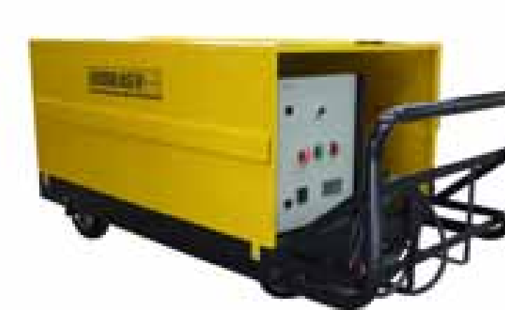
Eléctrica / Diesel sobre carro manual