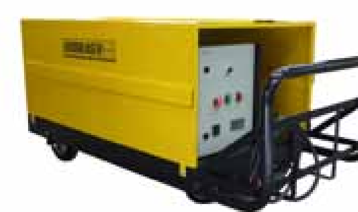
Eléctrica / Diesel sobre carro manual