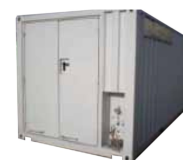
Equipos en container, estacionarios o sobre chasis

Cada sistema de alta presión Hidrolaser, puede ser configurado de acuerdo a las necesidades del cliente para obtener su máxima funcionalidad y prestaciones.