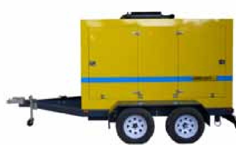
Diesel, sobre carro de arrastre, con o sin carenado.